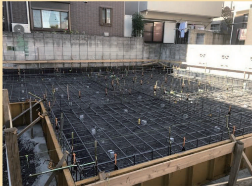
①当該物件(検査)を特定できる写真