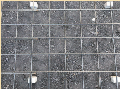
②基礎底盤部分の配筋状況等を確認できる写真