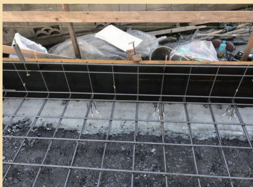
③基礎立上り部分の配筋状況等を確認できる写真